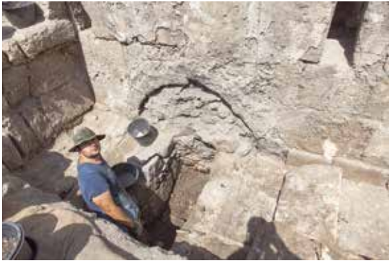
איור 7: צידו המזרחי של הכבשן באולם IV. מבט לכיוון מערב.