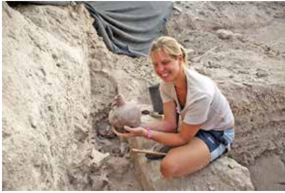
איור 10: ראשית החפירה במילוי בין שני קירות אולם II - 1973L. מבט לכיוון צפון.