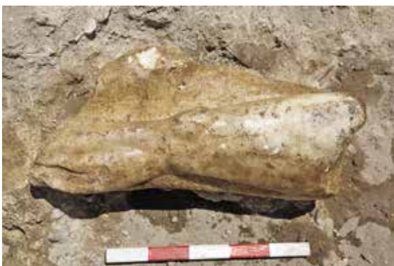
איור 12: שבר פסל שיש של רגל שרירית שנתגלה בין אבני הקמרון שקרס באולם V.