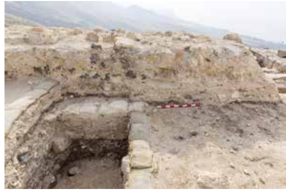
איור 6: צידו המערבי של אולם V. ניתן להבחין בשכבות השרופות של הרצפה הכפולה המחוממת ומעל סדרת רצפות מאוחרות יותר המכוסות בקריסת הקמרון. מבט לכיוון דרום.