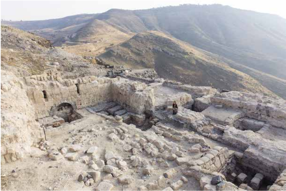
איור 3: השטח המרכזי מערבי של בית המרחץ הדרומי. מבט לכיוון דרום-מזרח.

המרחץ. בית המרחץ משתרע עשרות מטרים לכיוון צפון-מערב לאורך האוכף, והוא ככל הנראה חלק ממתחם פולחני שנבנה באוכף של סוסיתא בתקופה הרומית (מאה ב' לספירה) (איזנברג 2017: 19-22). מיקומו של המתחם סמוך לדרך העתיקה המעפילה ממזרח הכנרת לכיוון סוסיתא וערי סוריה במזרח, מעלה אפשרות שבית המרחץ שימש לא רק את תושבי העיר, אלא גם את תושבי כפרי האזור ואת הסוחרים שעברו בדרך.