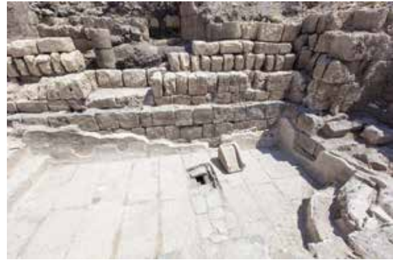
איור 9: חלקה המזרחי של הבריכה באולם II. ניתן להבחין בריצוף השיש, הטיח האדמדם שכיסה חלק מן הקירות, בשני גרמי המדרגות, בתעלת ניקוז פתוחה חלקית ומימינה באבן המעוצבת בדירוג. מבט לכיוון צפון-מזרח.

מבחינת כלל העדויות שהצטברו עד כה אנו יכולים לתארך את זמן הקמת בית המרחץ למחצית השנייה של המאה ה'ב' לספירה. סמוך לאמצע המאה הג' ככל הנראה עבר בית המרחץ סדרת שינויים ושיפוצים. בית המרחץ חדל לתפקד לא יאוחר מראשית המאה ה'ד'. אין אנו יודעים את הסיבה להפסקת תפקודו. הסברה שיש לקשור זאת לרעש האדמה של שנת 363 התבררה כשגויה מאחר שבתוך אחד מחללי הרצפה הכפולה וההרוסה, שנחתמה ברצפות טיח אחדות, נתגלו מטבעות מהמחצית הראשונה של המאה ה'ד'. גם מתחת לקריסת אבני הקמרון נתגלו מטבעות וממצא קרמי המאוחרים מרעש האדמה האמור. עם זאת, אין בכך כדי לבטל את האפשרות שרעש זה היה אחת הסיבות המרכזיות להפסקת השימוש בבית המרחץ. זמן קצר מתום הפסקת השימוש בבית המרחץ החל שימוש משני בחלק מן החללים שבו, ונבנו בו מבנים פשוטים. גם מבנים אלה ניטשו בטרם הקריסה הגדולה של קירות וקמרונות בית המרחץ, כפי שעולה מהיעדר ממצא תמים תחתיהם. מיעוט הממצאים מקשה לתארך את הקריסה הסופית שחתמה את מכלול בית המרחץ, אך מן הממצא שהתגלה מעל הרצפות ברור שהדבר התרחש בתקופה הביזנטית, לא לפני סוף המאה ה'ו'. ייתכן שרעש האדמה של שנת 749 הוא שהחריב כליל את המכלול.