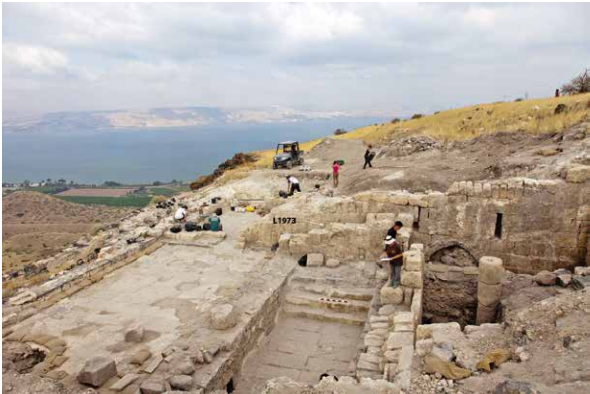
איור 8: אולם וברכה II. מבט לכיוון מערב.