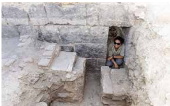
איור 4: צידו המזרחי של אולם III. אומנות ועמודונים העשויים לבני חרס כחלק מרצפת החמים הכפולה. קיר הבזלת והפתח הקרוע בו שייכים לשלב הראשון של המכלול עת שימש כבסטיון.