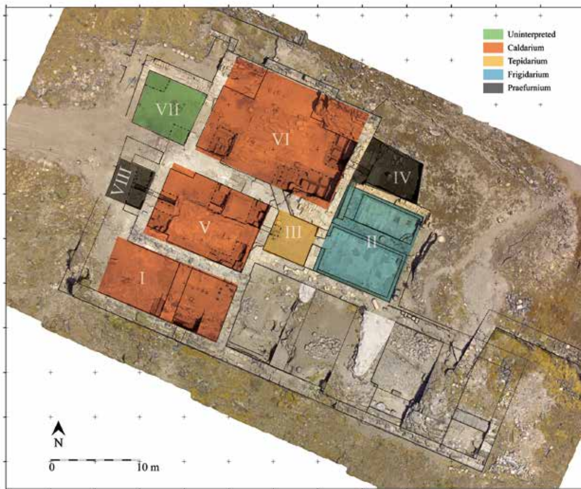
איור 2: בית המרחץ הדרומי. תצלום מיושר הכולל סימון החללים המרכזיים ותפקודם.

הדרומי". השני נבנה בצמוד לדקומוס מקסימוס, כ־50 מ' ממזרח לפורום. זה האחרון טרם נחשף, אך נערכה בו חפירת בדיקה מצומצמת ואפשר בנקל להבחין על פני השטח בבריכת השחייה ובמתקני מים נוספים (Segal 2014: 75; Tsuk forthcoming). אם לשפוט על פי מיקומו המרכזי בנוף העירוני, ייתכן שבית מרחץ זה היה המרכזי בעיר בתקופה הביזנטית. השרידים על פני השטח רומזים על היותו מהתקופה הביזנטית, אך אין לדעת אם קיים שלב בנייה מוקדם יותר. 6