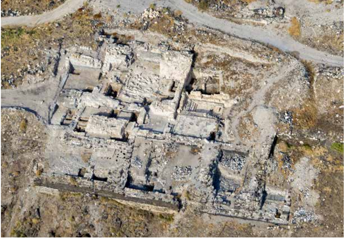
איור 1: בית המרחץ הדרומי, תצלום אוויר לכיוון צפון (יולי 2016).