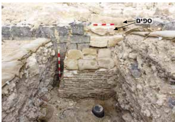
איור 5: שרידי אומנות ועמודוני חרס כחלק מרצפה כפולה מחוממת באולם V. מעל למפלס אומנת הלבנים ניתן להבחין בסדרת רצפות המבטלת את השימוש בחלל ומעליה בשני ספים העשויים אבן גיר.

נבנתה רצפה מרוצפת באריחי שיש. באולם II נוסף קיר תמך צמוד לקיר מרכזי קיים. המרווח הצר שנוצר בין הקירות הכיל מילוי ובו ממצא עשיר (L.1973), המספק לנו תיארוך לשלבי השיפוץ. נתגלו כאן עשרות כלי חרס, למעלה מ-150 נרות שמן ושברי כיור רבים, כולם מתוארכים לאמצע המאה הג' לספירה (איורים 8, 10; Eisenberg and Jastrzębska 2010: 47). נתגלו כאן גם חלקיו של תבליט עשוי בעבודת כיור ומציג דמות מיתולוגית, ככל הנראה